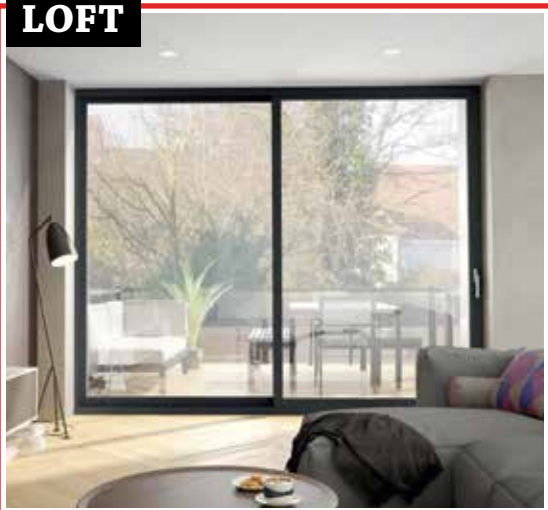
LEVANTE ET COULISSANTE