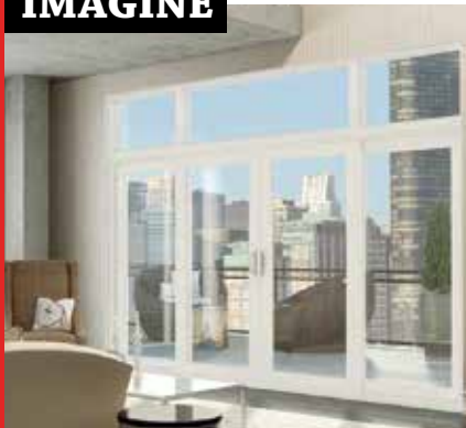
PORTE JARDIN COULISSANTE